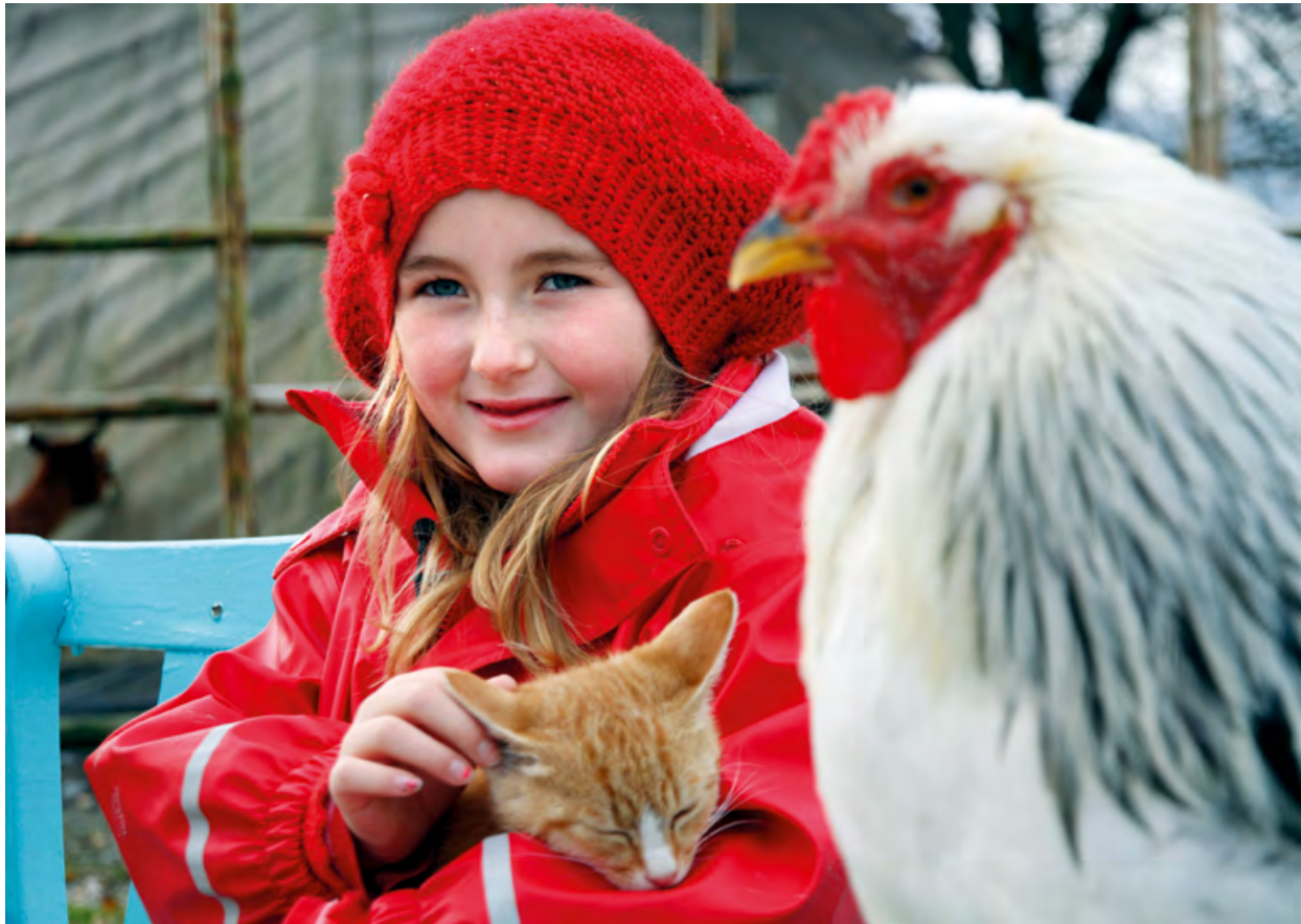
NRK-serien «Marit og dyra» er spilt inn på Sunnmøre.

og her er det selvsagt enklest å få tak i barn med østlandsdialekt. Men vi jobber aktivt for å få skuespillere med ulike dialekter til for eksempel dramaseriene våre, og det er det verdt å bruke litt ekstra ressurser på. Vi har også noen byråer som dubber tegnefilmer for oss, og de vet at vi vil ha ulike dialekter. I tillegg produserer vi en del programmer ved flere av NRKs distriktskontorer rundt omkring i landet, og da medvirker lokale barn. For eksempel har NRK Sogn og Fjordane laget flere serier der barn med nordvestlandsdialekt spiller hovedrollene.